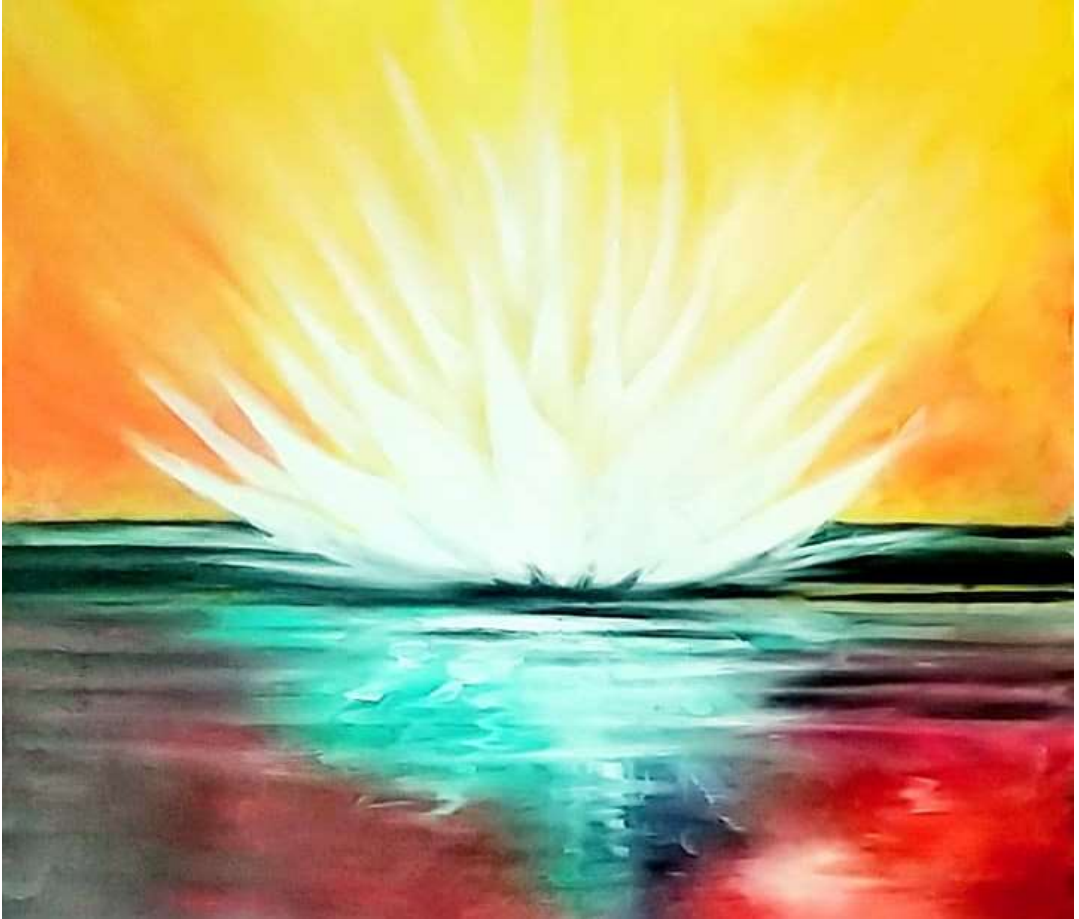
Lotus, peinture d'Hajar Masbah, 2018.