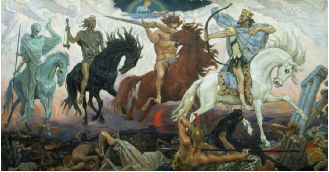
Les Quatre Cavaliers de l'Apocalypse (de gauche à droite) : Mort, Famine, Guerre et Conquête dans un tableau de 1887 par Viktor Vasnetsov. L'Agneau est visible au sommet.