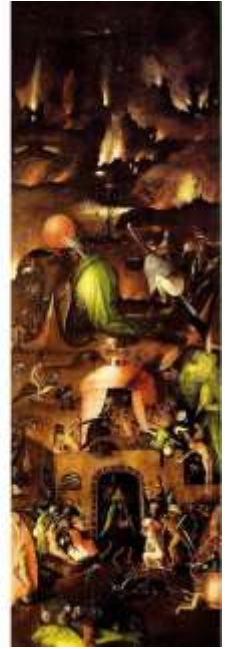
« Le Jugement dernier » est un triptyque du peintre néerlandais Jérôme Bosch, peint après 1482. Il est actuellement exposé à l'Académie des beaux-arts de Vienne (Autriche).