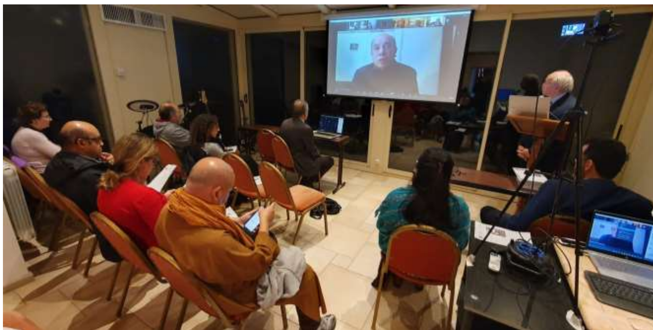
Quelques-uns des participants en présentiel à Orsay.