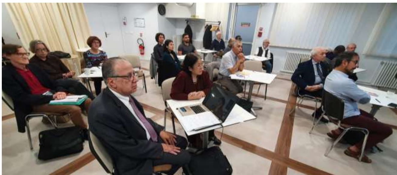
Quelques-uns des participants en présentiel à Paris.