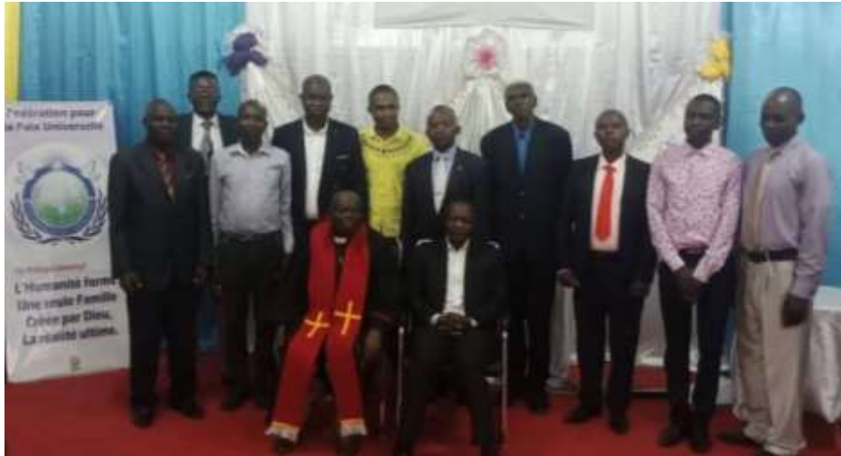
Réunion en présentiel à Kinshasa (R.D.C.)

Enregistrement de l'événement : https://www.youtube.com/watch?v=eDFfDn_4ssw