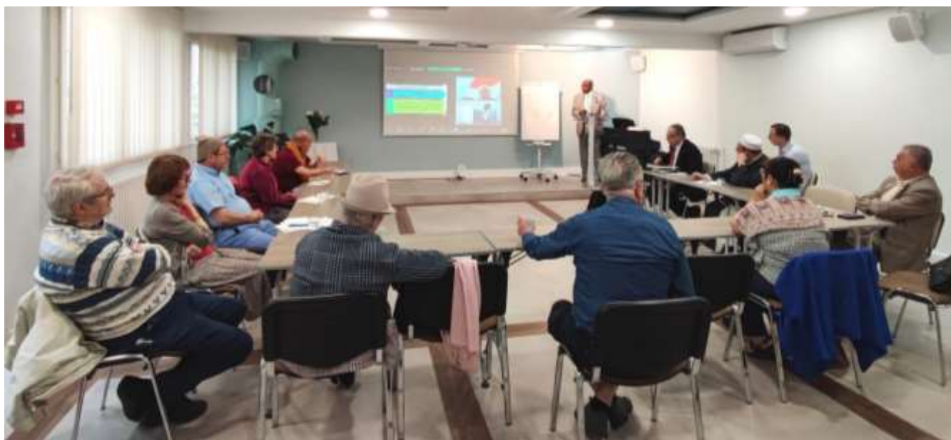
Réunion en présentiel dans l'Espace Barrault, à Paris 13 e et par Zoom.