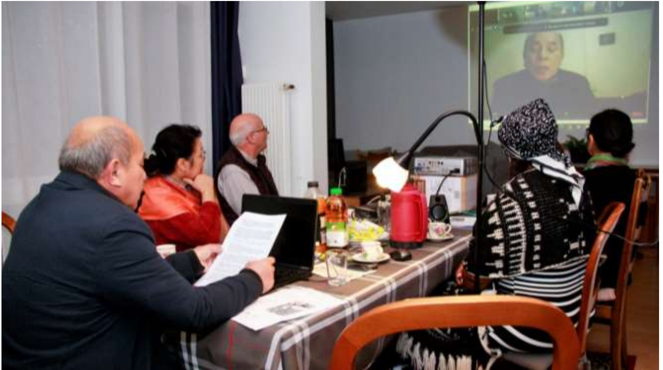
Quelques-uns des participants en présentiel à Lille.