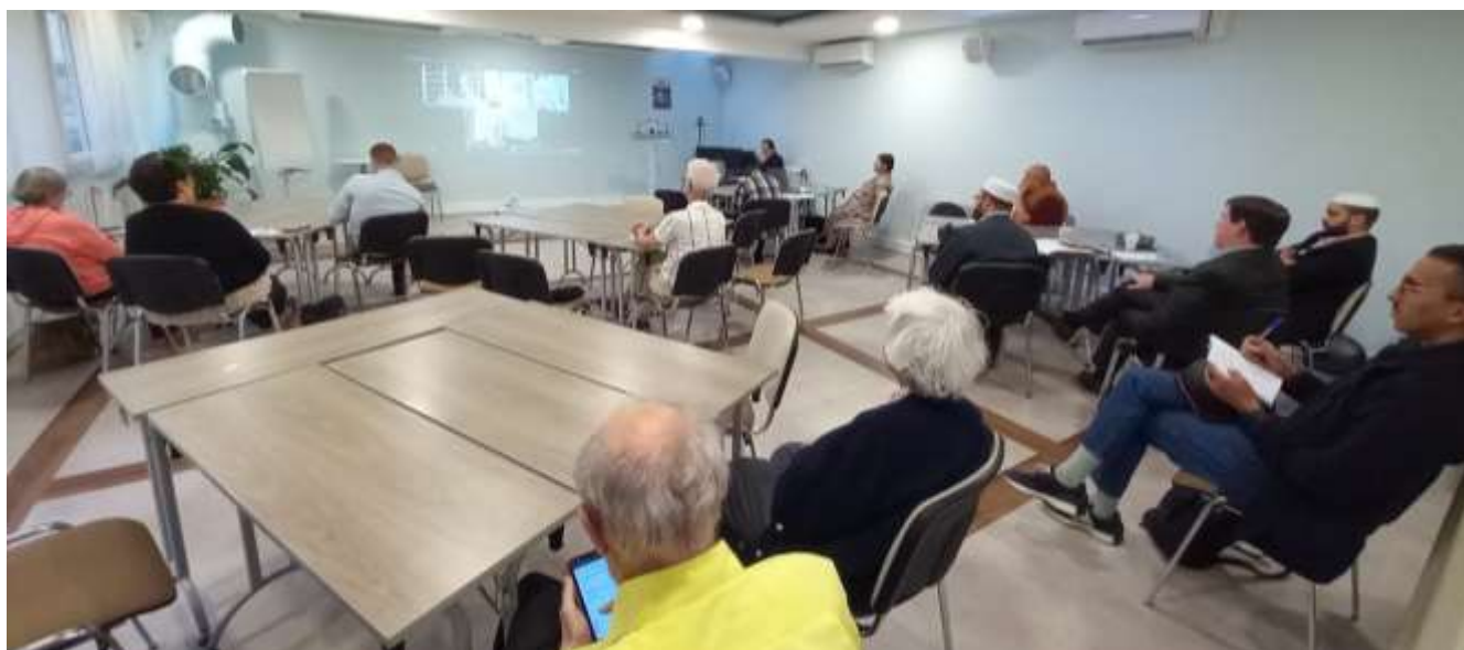
Quelques-uns des participants en présentiel à Paris.