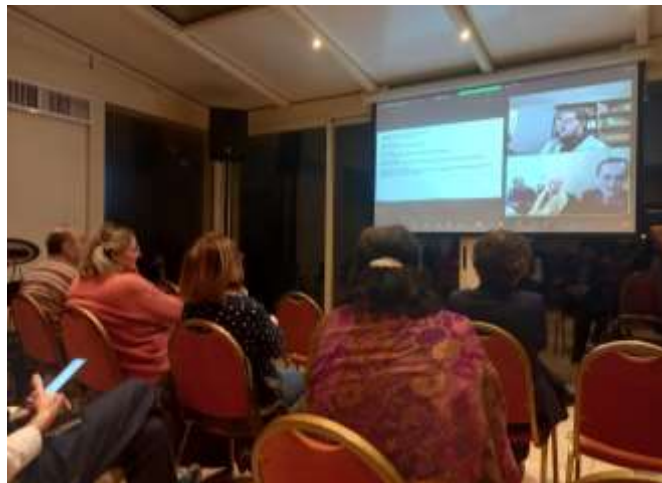
Réunion en présentiel à Genève (Suisse) et Orsay (France)

Pour bien clôturer l'année, nous avons organisé, le dimanche 11 décembre, le 20 e Partage « Dialogue & Alliance » sur le thème : « Dieu au féminin ».