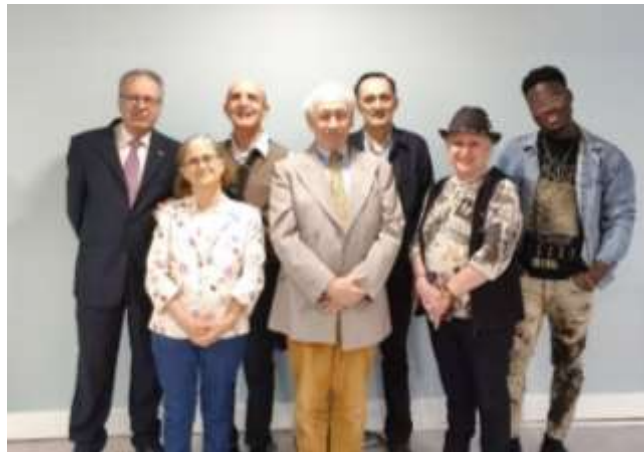
À gauche, quelques-uns des intervenants à Lille (Nord) ; à droite, quelques-uns des participants en présentiel à Paris.